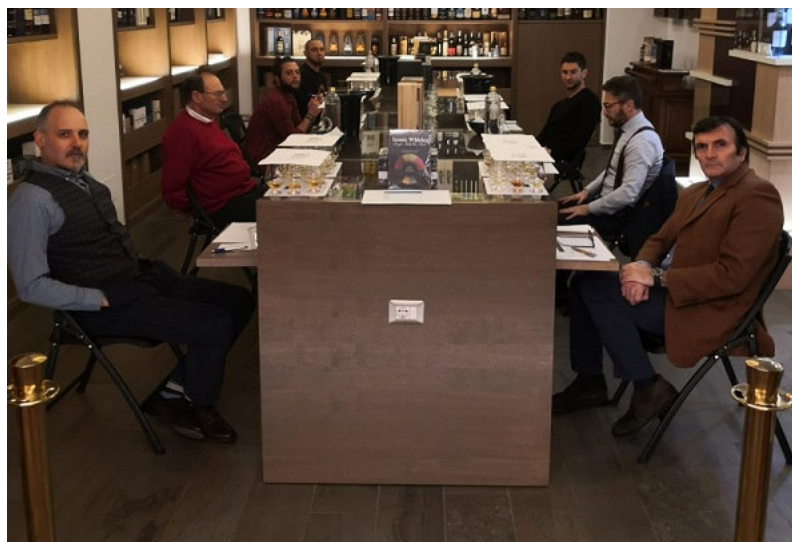
La giuria riunita (quando ancora era possibile riunirsi)

Publicato in Il Premio (/Index.php/il-premio) il 28 Aprile 2020