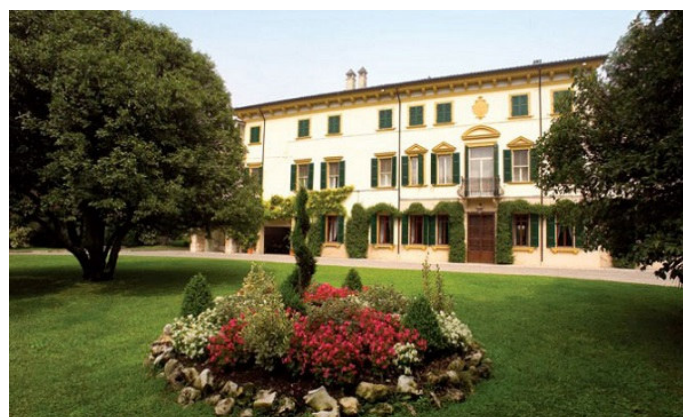
Casa Vinicola Sartori